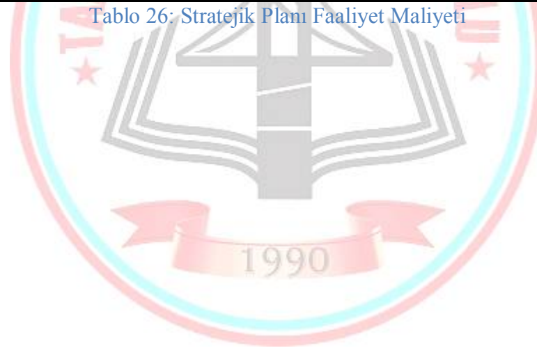
Tablo 26: Stratejik Planı Faaliyet Maliyeti